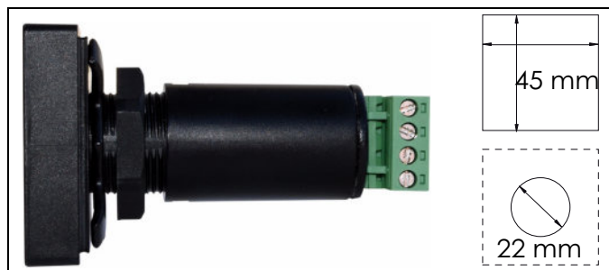
Dimensioni: 49,5 x 49,5 x 110 (Profondità) Dimensions: 49,5 x 49,5 x 110 (Depth)